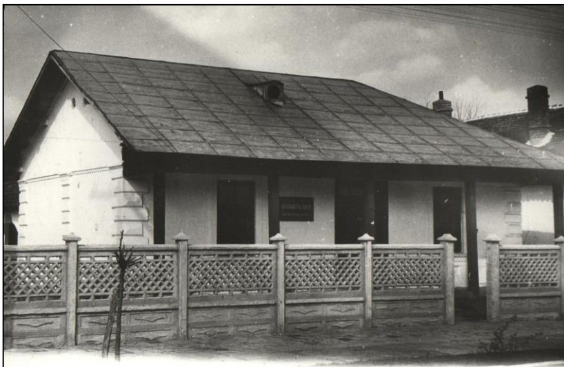
Grădinița de copii

În comuna noastră funcționează un liceu de cultură generală și o școală generală cu clasele I-VIII și 2 grădinițe de copii.