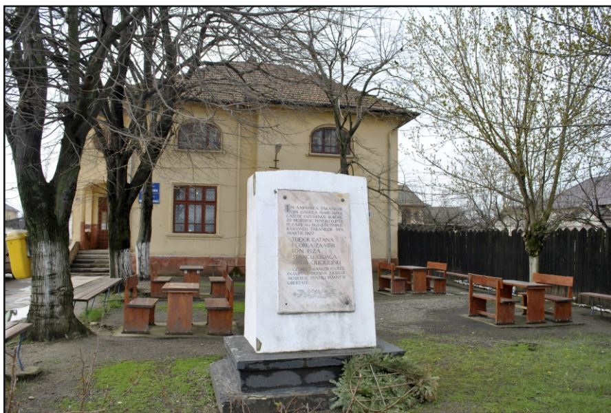
1907 - Placă memorială